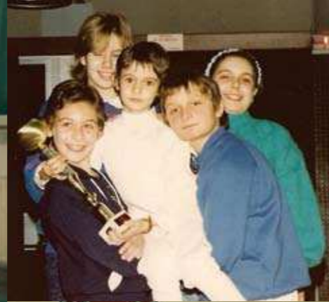
IN QUESTA PAGINA, DA SINISTRA IN ALTO IN SENSO ORARIO: